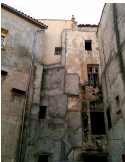
Des cœurs d'îlots dévalorisés