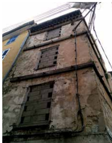
Des biens entièrement vacants, des "ruines"