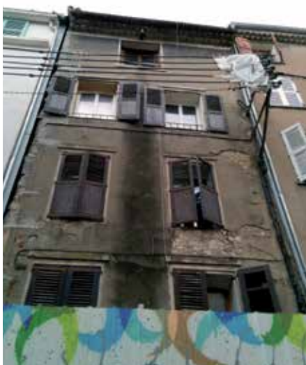
Des biens très dégradés