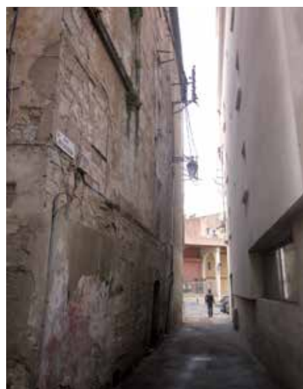
Des secteurs dégradés ou moins propices à la qualité résidentielle d'îlots dévalorisés

"L'habitat dégradé du Centre-ancien engendre un sentiment d'insécurité et d'insalubrité alors que paradoxalement c'est un secteur avec un fort potentiel architectural et économique."